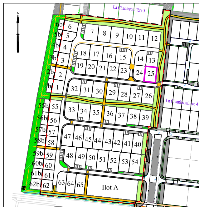
Plan général du lotissement - sans échelle