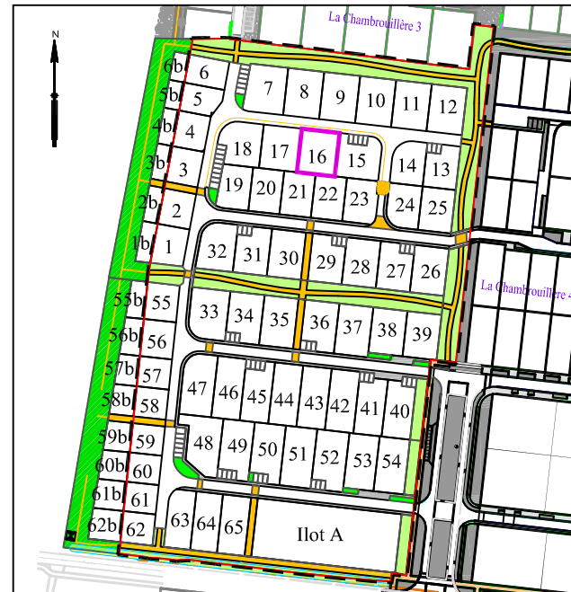
Plan général du lotissement - sans échelle