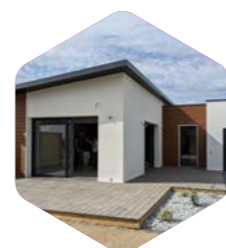
Terrasse en bois