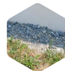
Pieds de murs en gravillons