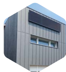
Zinc prépatiné quartz ou anthracite