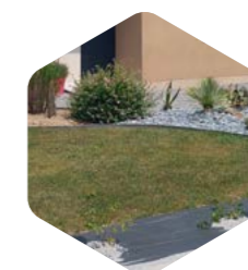
Engazonnement du terrain