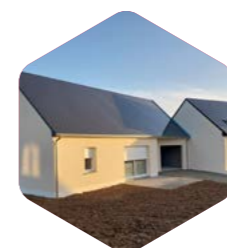
Terrasse en béton poreux