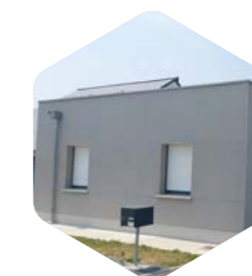
Toit plat étanchéité