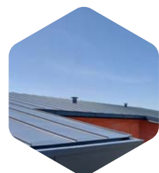
Acier zingué (PLX)