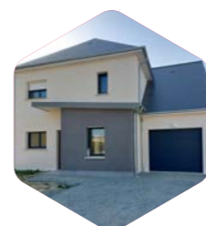
Jeux d'enduits possibles (sur une façade, entre ouverture, ...)