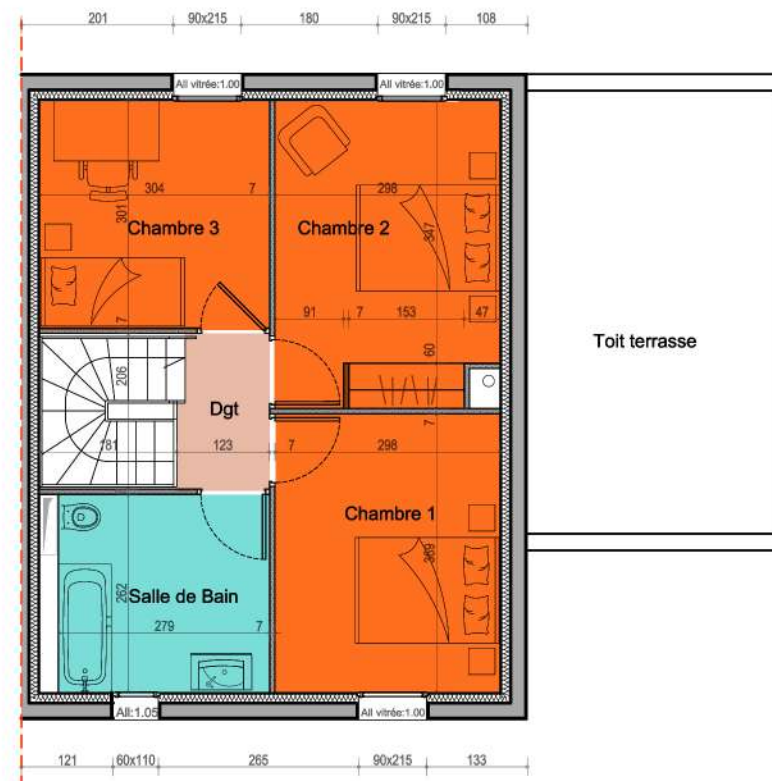
Plan de l'étage

NB: Les surfaces portées sur le présent plan sont susceptibles de variations en fonction d'impératifs administratifs ou techniques