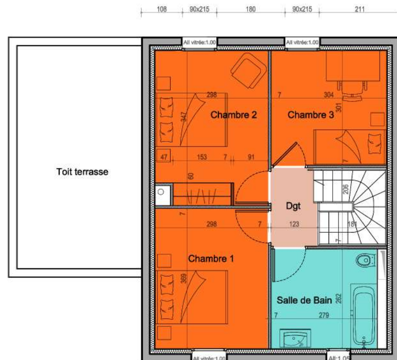
Plan de l'étage

NB: Les surfaces portées sur le présent plan sont susceptibles de variations en fonction d'impératifs administratifs ou techniques