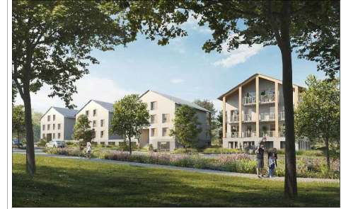
Les jardins de Lily Rue du Haut Launay Erdre-Portrerie - 44300 Nantes