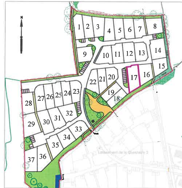
Plan général du lotissement - sans échelle