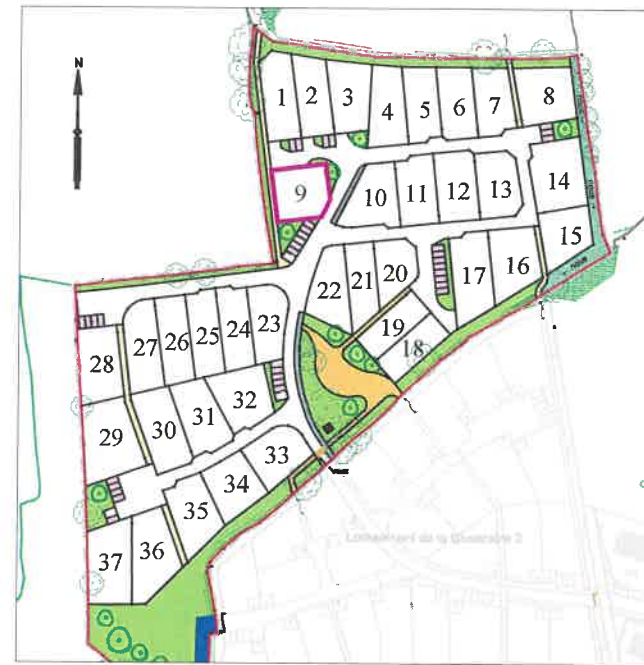
Plan général du lotissement - sans échelle