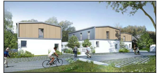
MAUVES SUR LOIRE A l'Orée du Bois