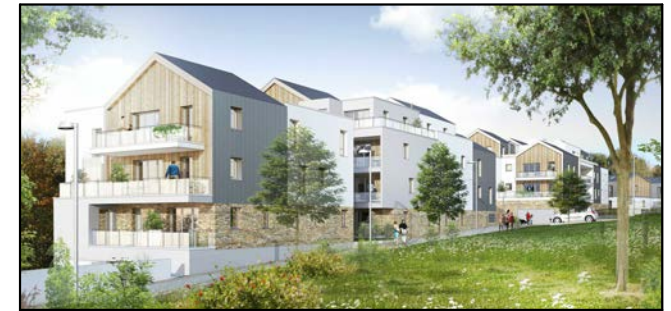
MAUVES SUR LOIRE A L'Orée du Bois