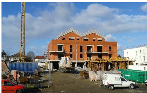
Vue vers la façade Sud du bât B.