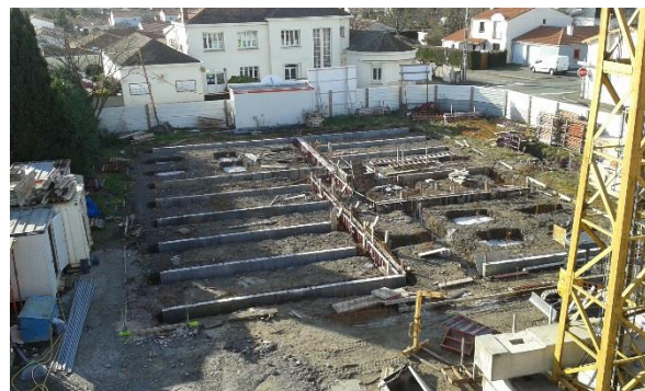
Fondations du bâtiment. A réalisées.