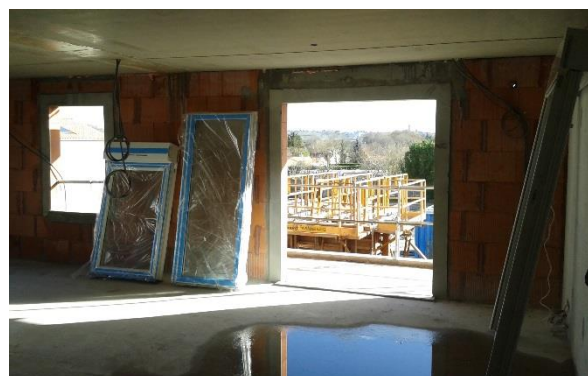
Approvisionnement des menuiseries ext bat B.